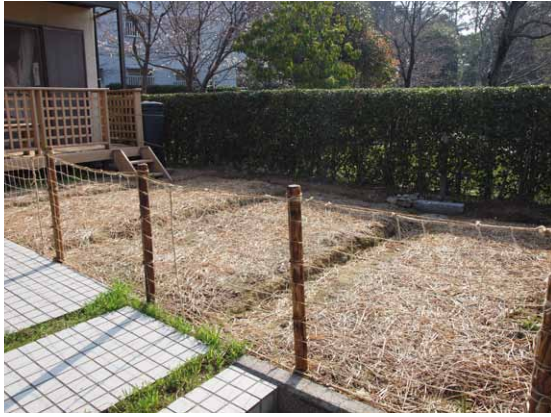
↑今日の作業をする前の様子