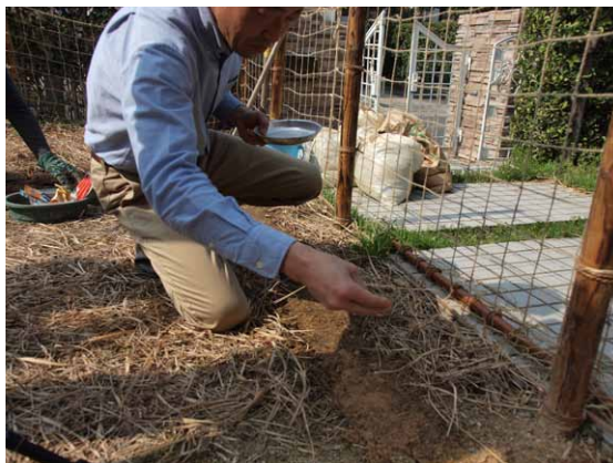
③種をバラ蒔きする。(間引きしやすいように点蒔きでもよい)