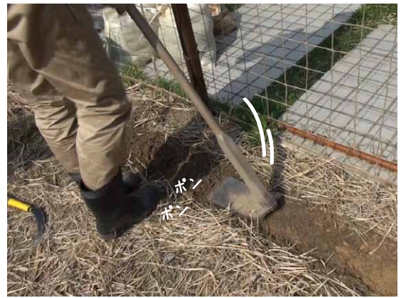
②剥いだ部分を手のひらや平鍬等で軽く抑えて平らにする。