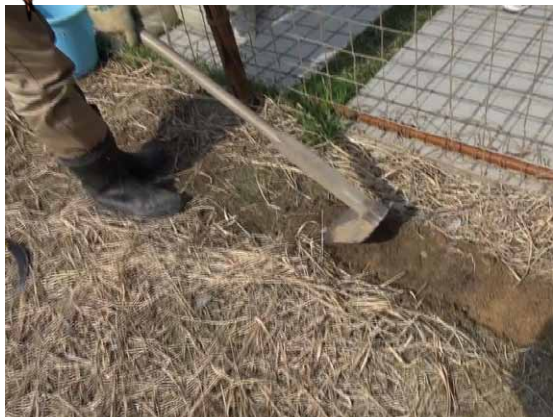
①表面の土を薄く剥ぐ。(雑草の種を除くため)