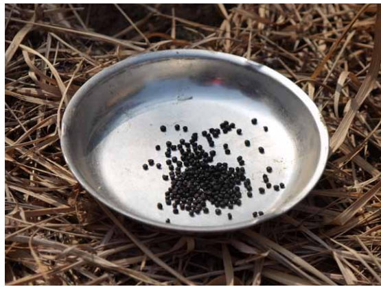
↑アスパラの種たち

アスパラは収穫までに数年かかり 一度植えつけると10年ぐらい収穫できるので、 畝の端など植える場所を固定する。