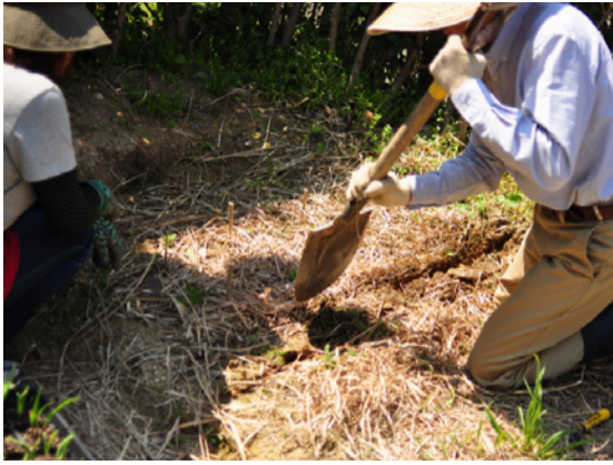
① 植える場所を決めたら穴を掘る。