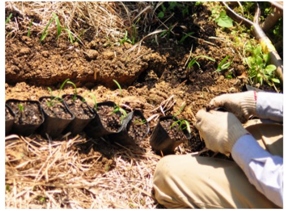
② 約 15~30 cm 間隔で苗を置き、土をかける。