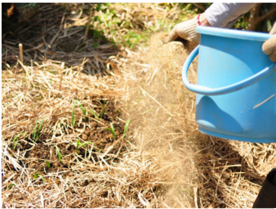
③ 全体に軽く補いをして、葉に付着した補いを払い落としながら、乾燥しないように土に枯草をかけて完成。