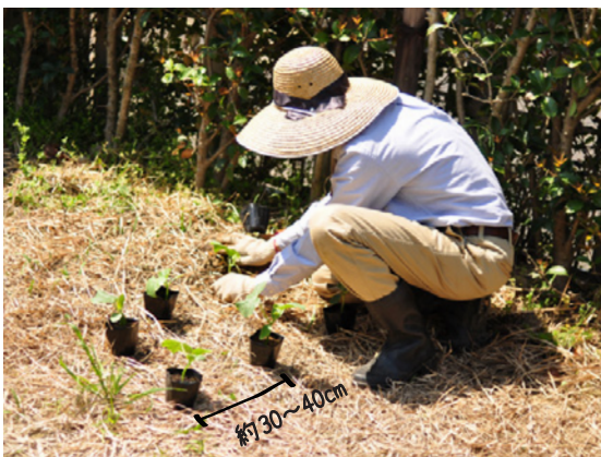
① 苗が入る大きさの穴を 30 ~ 40 cm 間隔で掘る。きゅうりは大きくなるので、なるべく広めに間隔をとると良い。土が乾燥している時は、植え穴に水をたっぷり注ぎ入れ、水を染み込ませてから苗を入れる。