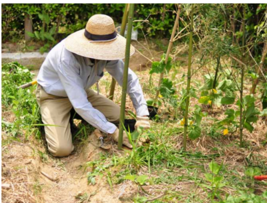
②前回種を植えたところは発芽していなかったので、苗付けをした。