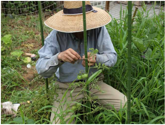
①大玉・中玉・プチ共に雑草を刈り、支柱を立てる。