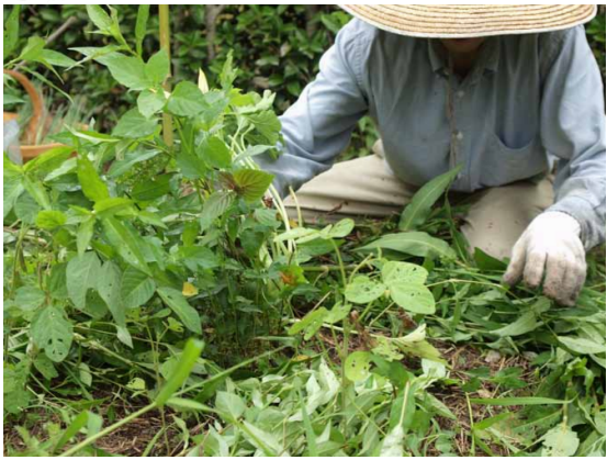
①周りの雑草を刈る。