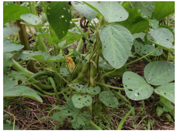
↑少し枝豆がついていた！