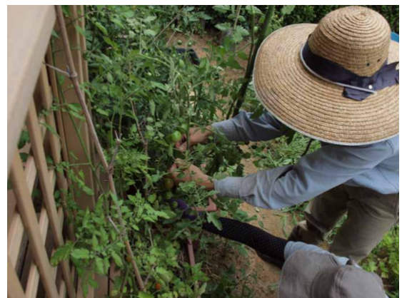
②根元に近い小さな枝を少し芽かき。