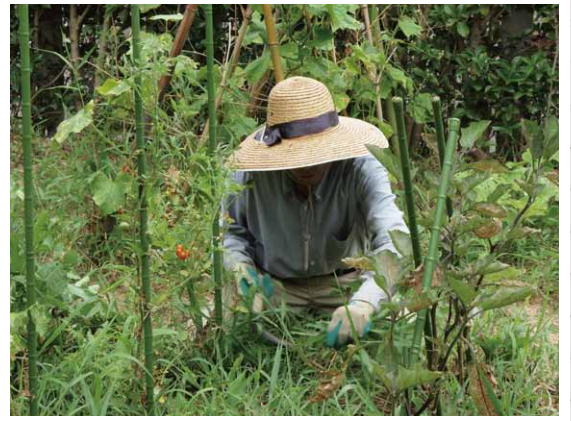
①軽く周りの雑草を刈った。