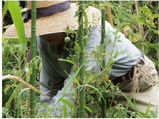
①少し実がついているがまだ青いので そのまま放置。軽く周りの雑草を刈った。