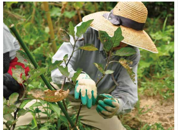
①葉の裏の卵をつぶして駆除し、軽く雑草を 刈ってナスが実ることを祈りつつおぎないをした。 ※葉を切り落としてしまうと光合成ができなくなるので、 出来るだけ卵をつぶすだけにして葉を残す。